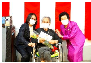
『米寿(88歳)の記念撮影😊』