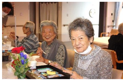
『お食事最高! 星3つです★★★★』