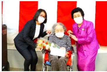
『101歳おめでとうございます(祝)』