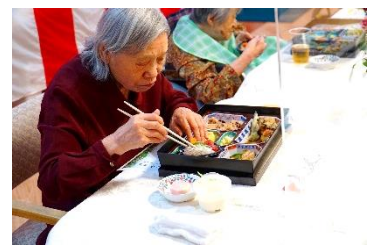
『今日のご飯は特に美味しいね!』