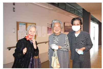
『今日の思い出に記念撮影📷』