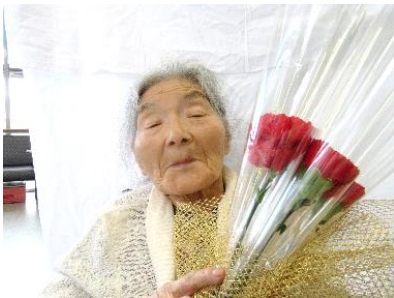
『 おかあさん、いつもありがとうございます❤️ 』