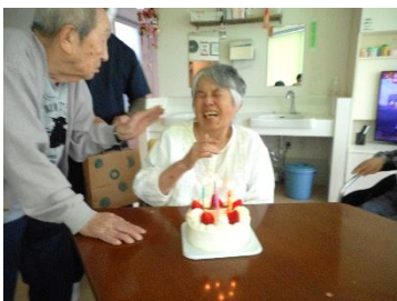
『お誕生日、おめでとうございます🎂』