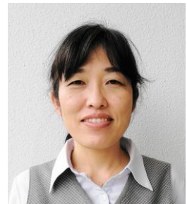
高齢者あんしん相談センター ブロン 社会福祉士 S・S