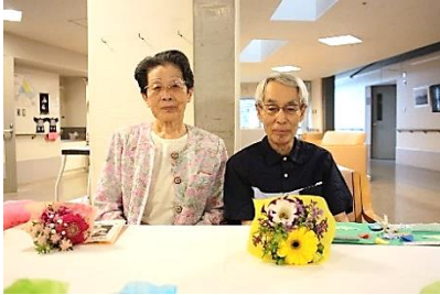
『お誕生日おめでとうございます🎁』