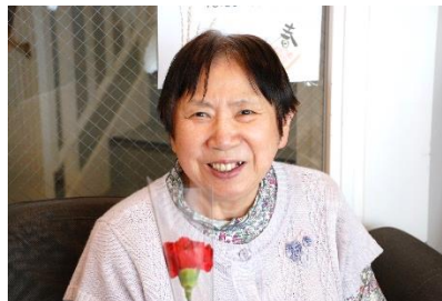
『いつもありがとうございます🌸』