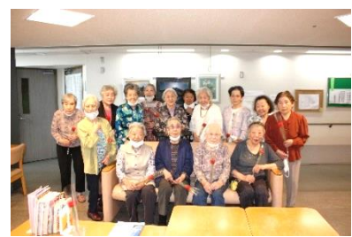
『女性の皆様で集合写真📷』