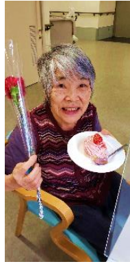
『ケーキも美味しそう』