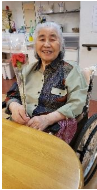
『カーネーション、綺麗ね🌸』