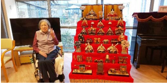
『 満面の笑みでツーショット 』