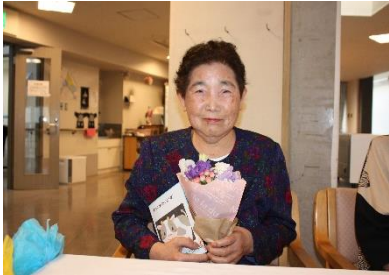
『おめでとうございます🎉』