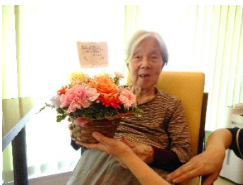
『とってもきれいだわ！』