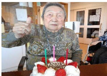
『ケーキと一緒に、はい、チーズ📷』