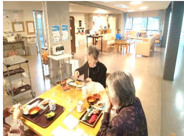
『お寿司や丼ぶり、揚げ物に麺類。皆さんあっという間に完食🍴』