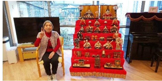
『 雛人形とお揃いの赤コーデ♥ 』