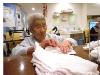
『お手伝い、ありがとうございます😊』