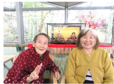
『 ひな人形と一緒に、はいポーズ♪ 📷🌸 』