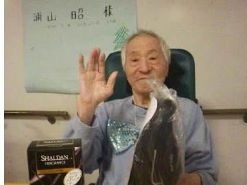
『プレゼント、ありがとう♪』