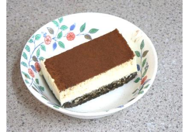
『ケーキはティラミスでした♥』