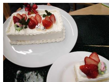
『クリスマスケーキ♥』