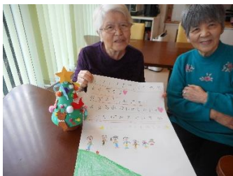
『思いがけないプレゼント♥』