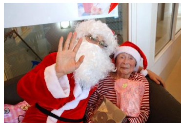
『サンタと一緒に はい、チーズ📷🎅』