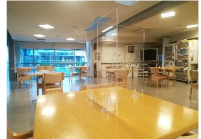
『食堂にはパーテーションも設置済み!』