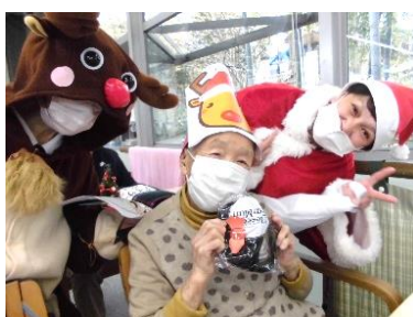
『プレゼントは“耳当て”でした』