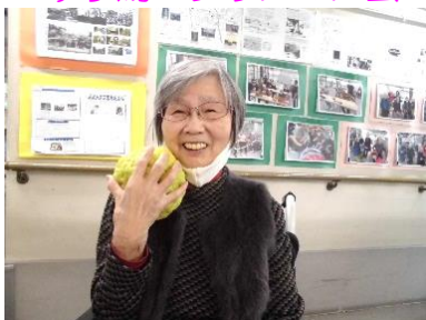
『獅子ゆずと一緒に😊』