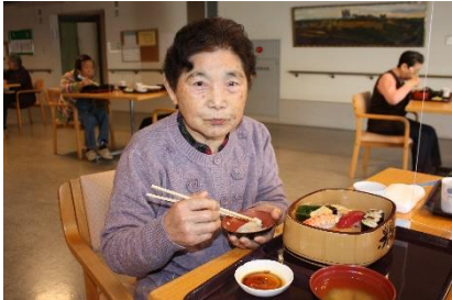
『握り寿司、美味しいよ♥』