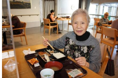
『カツは分厚いけど柔らかいね〜』