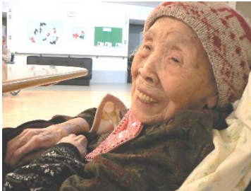
『祝100歳！笑顔が素敵です😊』