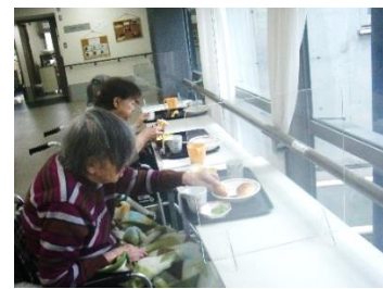
『隣との間も仕切っています』