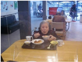
『透明だから気にならないね👍』