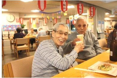
『 がんばーい 🍡 』