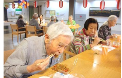
『焼きそばもおいしい味だよ👍』