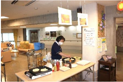
『手づくりお好み焼きです♥』