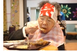
『焼きそばも美味しいわよ!』

現在新型コロナウイルスが流行し、マスクの需要が高くなっている中、家族会の皆様から マスクを寄付 して頂き、本当にありがとうございました。大切に使用させていただきます。