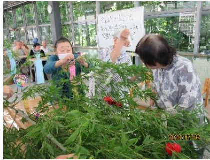
『次に七夕飾りと短冊を取り付け・・・』