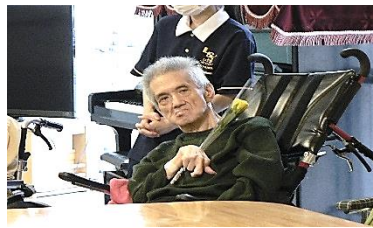
『いい香りがするよ😊』