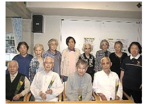
『みんなで記念撮影』