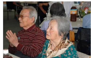
『ご夫婦で仲むつまじく♡』