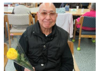
『お父さん、いつもありがとうございます!』