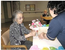
『お誕生日おめでとうございます!』