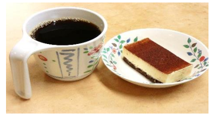
+ 『美味しそうなおやつ♪♪』