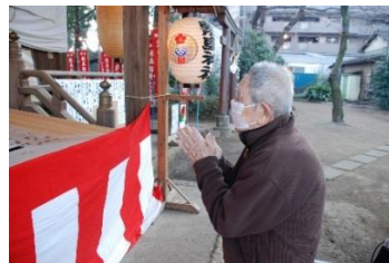
『健康に過ごせますように♥』