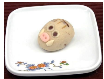
イノシシの「練り切り」

閉会の際には「この一年も、みなさまが健康で明るい毎日を過ごしていただけますように」との願いを込めた挨拶で締めくくりました。