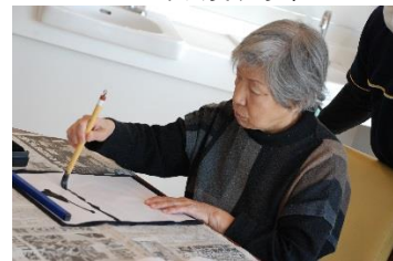
『筆を持つ表情は真剣そのもの!』