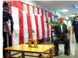
『投扇興。的はうまく倒れるかな??』