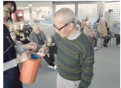
『おみくじの結果は◎』