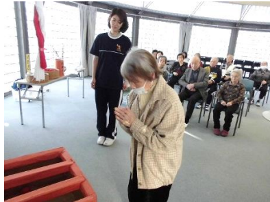
『今年は〇〇でありますように...』