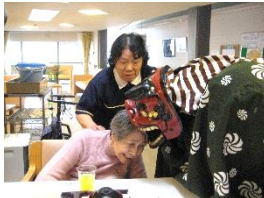
『獅子舞に噛んでもらって無病息災♥』