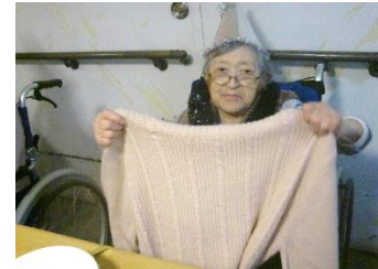
『プレゼント、ありがとう♥』