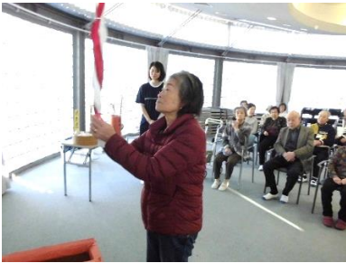
『どんなお願いをするのかな?』