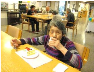
『ケーキ美味しいね〜♡』