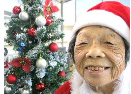
『素敵なツリーが出来ました♡』