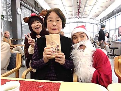
『クリスマスプレゼント♡』