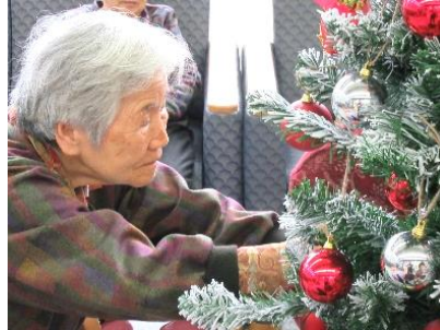
『みんなでツリーの飾りつけ♡』