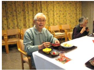
『クリスマスディナー!!』