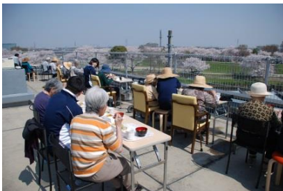
『いいお天気でした』