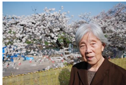
『桜を背景に、はいポーズ』