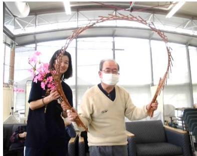
『南京玉簾を披露していただきました』