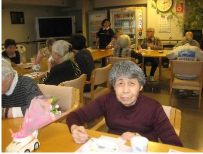
『ケーキ美味しいね』