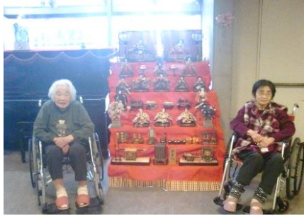
『雛人形かわいいね』