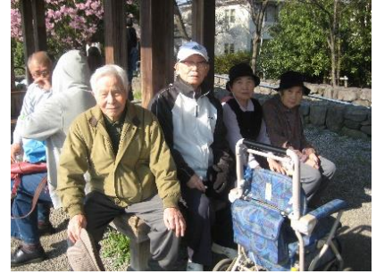
『桜散策休憩中・・・』