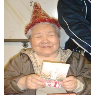
『プレゼントに笑顔』