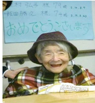
『プレゼントの帽子似合っています』