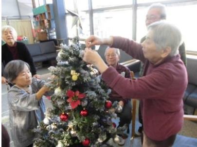
『クリスマスが待ち遠しいですね』