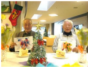
『お誕生日おめでとう』