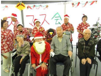
『ウクレレパレードの皆様と記念写真』