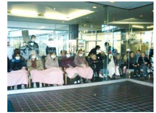
『カメラ目線でピース！』『おやつは手作りケーキ』『職員によるお餅つき』『寒そうねえ～頑張れ～』