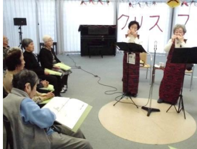
『ハーモニカの調べ』