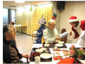
『プレゼントもらったよ』