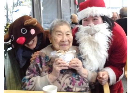
『ブロンサンタのプレゼント』