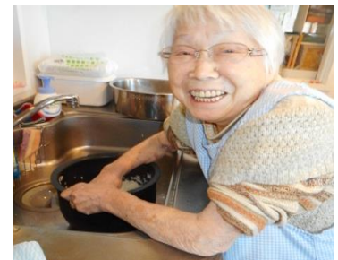
『ご飯の用意をしなくちゃ』