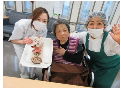
『おいしくいただきました』