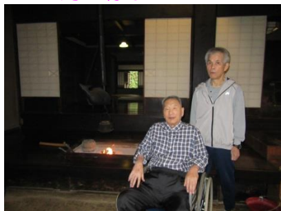
『難波田城公園 囲炉裏のイベント』