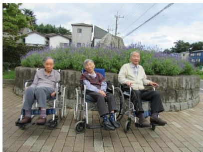
『山崎公園へドライブ』