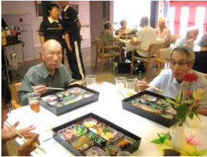
『美味しいお食事に舌鼓』