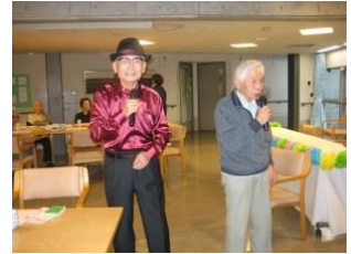
『誕生会での歌声披露』