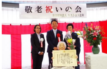
『100歳おめでとうございます』