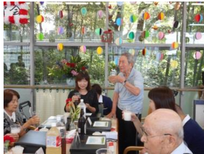
『敬老祝賀会での乾杯』