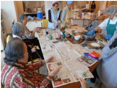
『皆さんでコロッケ作り!』