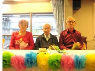
『誕生日おめでとう』