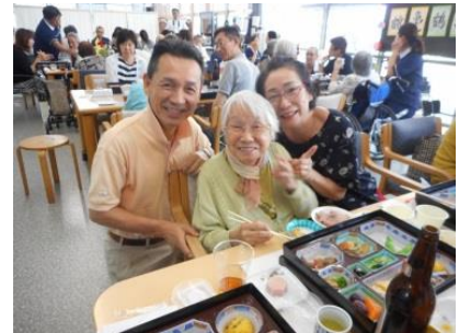
『敬老会でハイチーズ!』