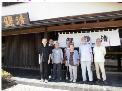
『お店の前で記念写真』