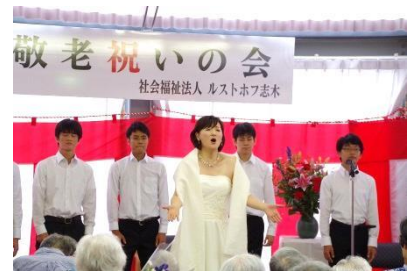
『美声に聞き入って』