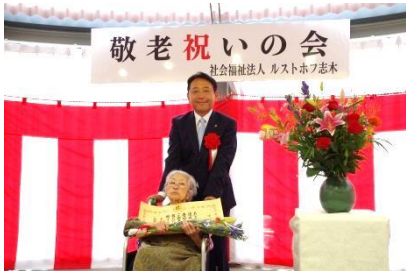
『100歳おめでとうございます』