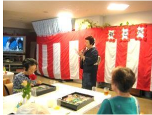
『詩吟のプレゼント』