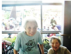
『敷地内の木陰にて』