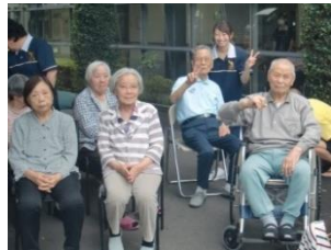
『敷地内の木陰にて』