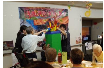
『聖火台に炎が灯りました!』