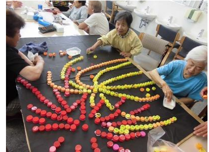
『カレンダーづくり』