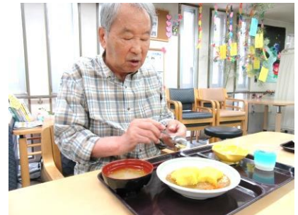
『カレー美味しかった!』