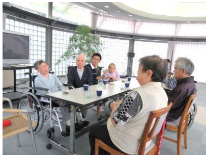
『願い事が叶いますように』