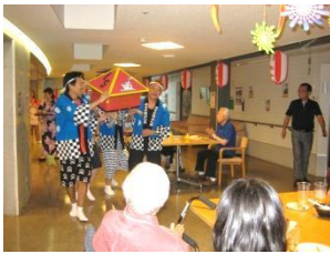
『お神輿ワッショイ』