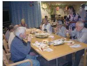
『美味しい食事とお酒』