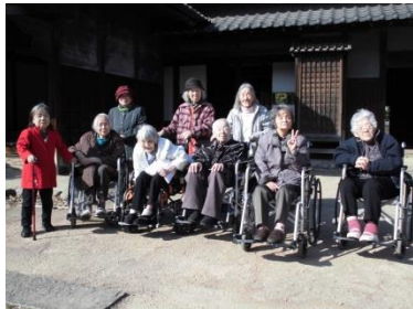
『難波田城公園へお出かけ』