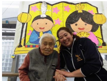
『手を取り合って良い笑顔』