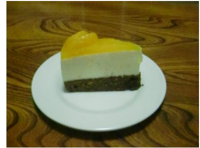
『健やかに過ごせますように!』