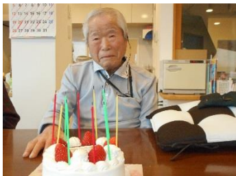
『百寿おめでとうございます♪』