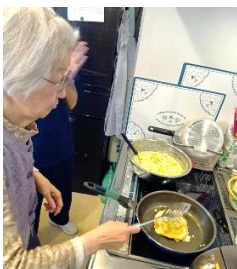
『テキパキと焼いていきます //』