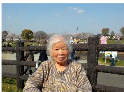
『青空の下は気持ちがいいね 🌸』