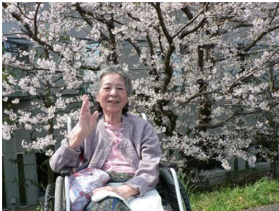
『桜の前で記念撮影です📷』