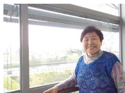
『雨の日もラウンジから楽しめます ♪』