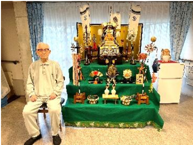
『鎧飾りと並んで記念撮影📷』