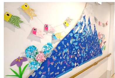
『室内でも季節感を味わえます❤️』