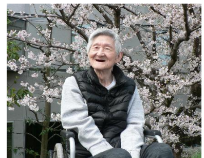
『やっぱり春はいいな〜❤️』