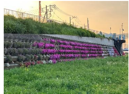
『夕陽と春色に彩られて🌸』