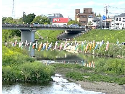
『鯉のぼりが泳ぐ景色🐟』