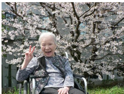
『満開の桜は最高だね!🌸』