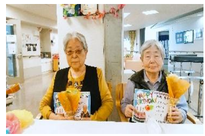
『おめでとうございます🌸』