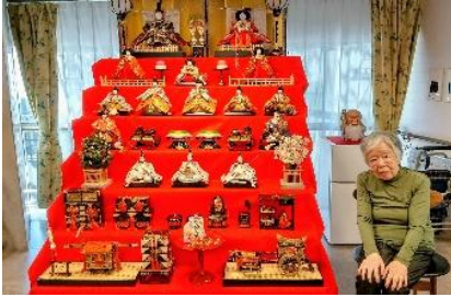
『おひな様と一緒に📷』