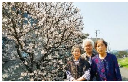
『桜を背景に、こちらでも📷』