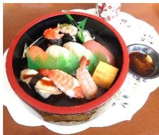
『新鮮なネタのお寿司。美味しかったですね🍣』