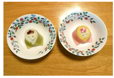
『おひな様の形をした練り切りです🍡』