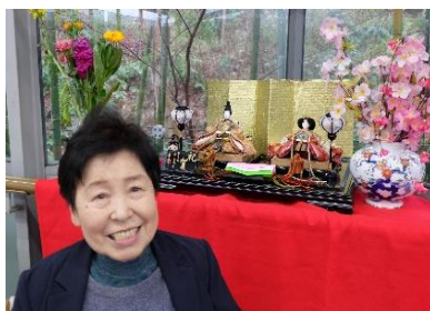
『おひな様と一緒に。皆様、とっても素敵な笑顔でした❤️』