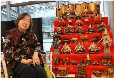
『綺麗でかわいいね❤️』