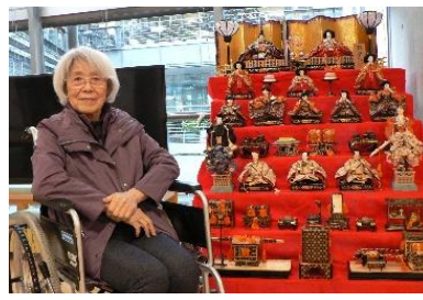
『ひな飾りと一緒に、はい、チーズ🇯🇵』