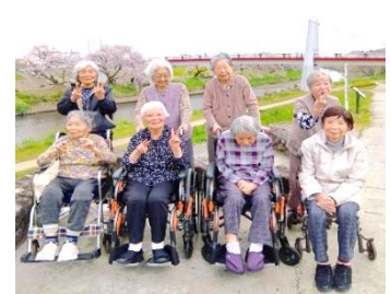
『皆様と一緒にお花見🌸』