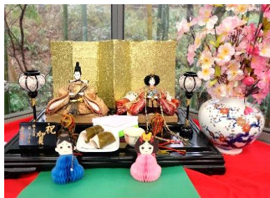
『フロアに飾られたひな人形 🍡🍡』