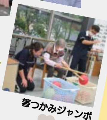
箸つかみジャンボ