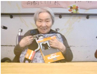
『プレゼントありがとう♪』