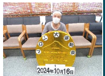
『優勝チームには金メダル🏆』