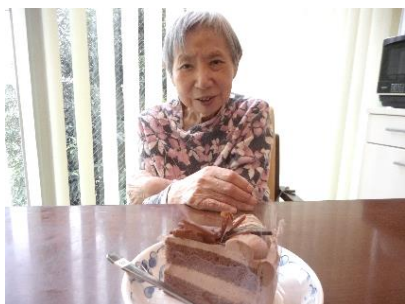
『わたしはこれを選びました🍰』