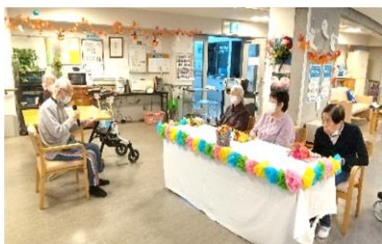
『誕生日、おめでとうございます』