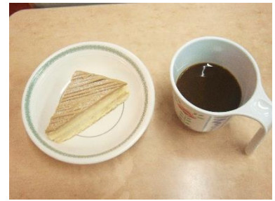
『大好評だったモンブラン🍰』