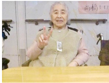
『さっそく着てみました♥』