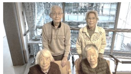
『記念撮影、はい、チーズ📷』