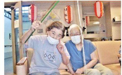
『魚釣りゲーム、大漁でご満悦😊』