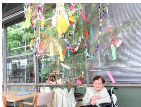
『願いがかないますように☆』