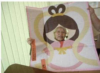
『織り姫様の登場です✨』