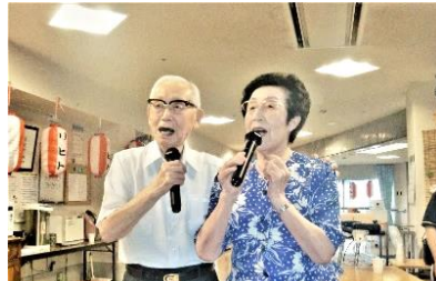
『銀座の～ 恋の～ 物語～♪♪』