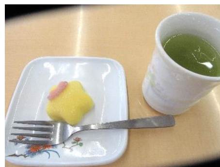
『デザートに、星形の「練り切り」を召し上がっていただきました』