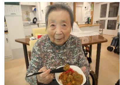
『夏野菜カレー、おいしいね😊🍴』