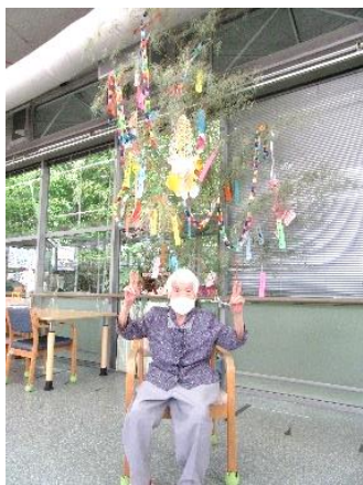
『頑張って作りました！！』