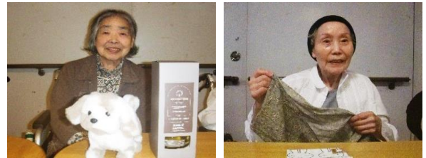
『誕生日プレゼント、ありがとう❤️』