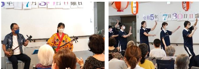
『三線の演奏です♪』 『職員による志木おどり😊』