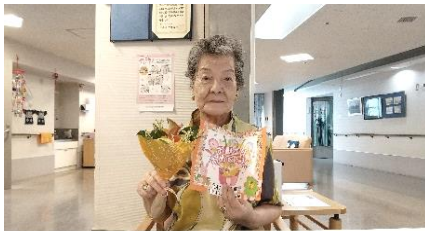
『お誕生日、おめでとうございます♥️』