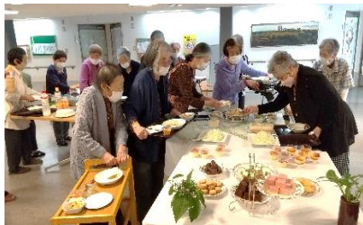
『何を食べようかな😊』