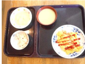
『美味しそうなオムライス、いただきまーす🙏』