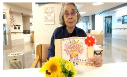
『おめでとうございます❤️』