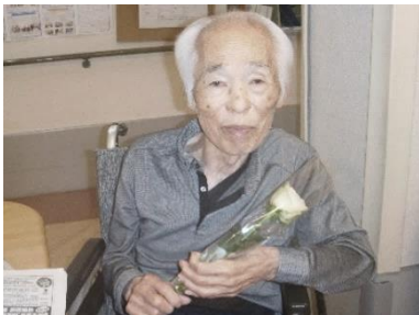
『お花と一緒に、はい、チーズ😊』