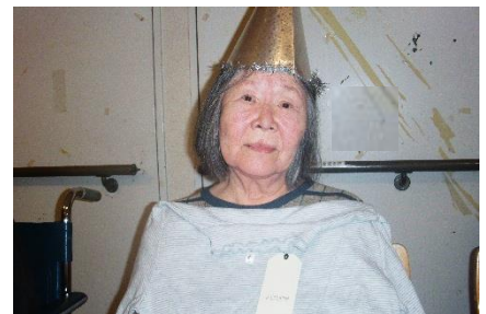
『誕生日、おめでとうございます❤️』