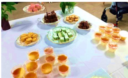
『デザートも盛りだくさんでした🍰』