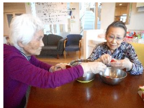
『苺のヘタを取っています🍓』