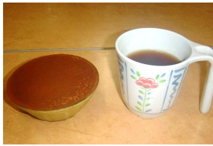
『デザートのカティアミスが好評でした🍰』