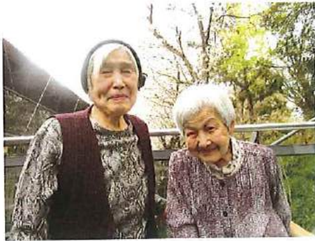
お花見 デイサービスフロアを出てすぐの所に 咲く桜を楽しみました