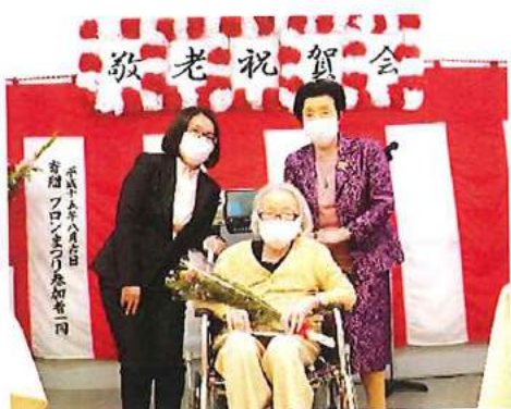
【表彰されたご利用者の記念撮影】