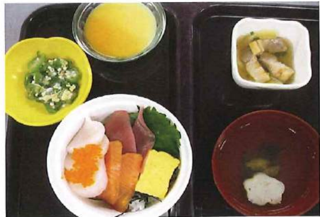
【新春特別メニュー】