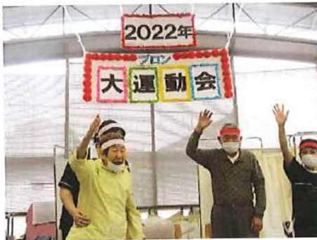
運動会 選手宣誓！盛り上がりました