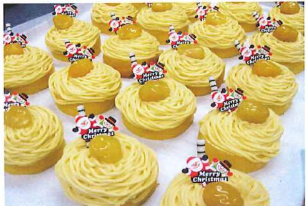
【Xmasケーキ モンブラン】