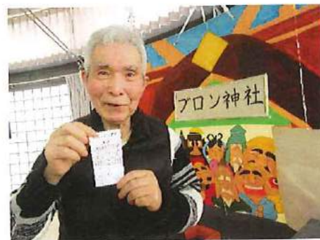
初詣 館内に建立された「ブロン神社」での 初詣となりました