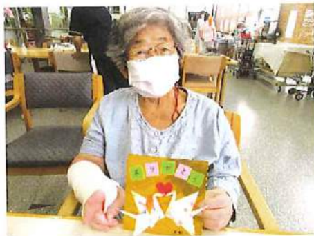
余暇活動 折り紙やカードゲーム、塗り絵などを 行っています