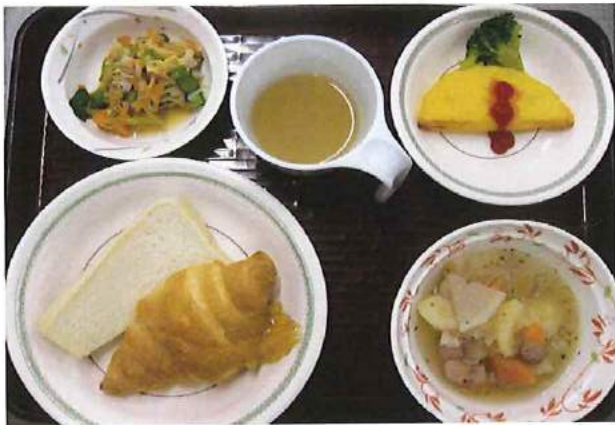
【スペシャルモーニング 洋風】