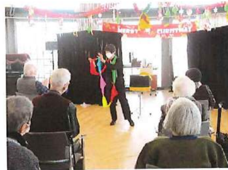
クリスマス会 マジックショーや音楽会を楽しんでい ただきました