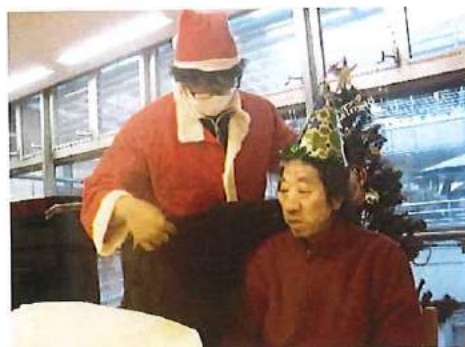
【クリスマス会の様子】