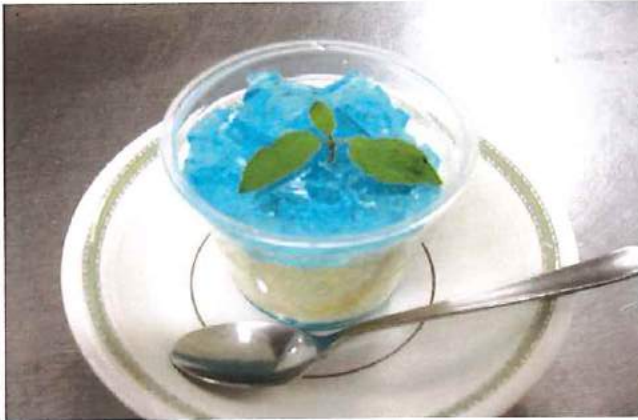
【誕生日おやつ 夏のゼリー】