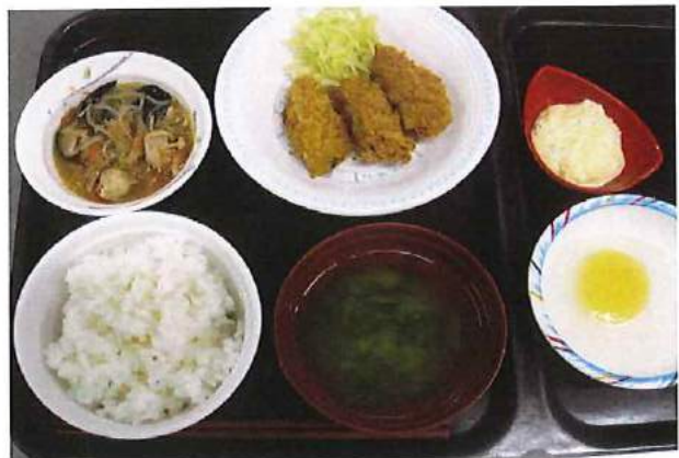
【リクエストメニュー カキフライ】