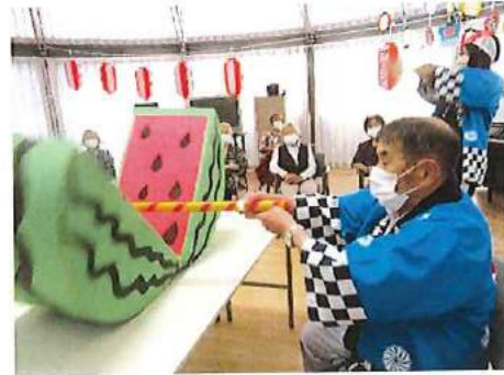
夏祭り スイカ割り・金魚すくい等を行い、志木 踊りや炭坑節、東京音頭を踊りました