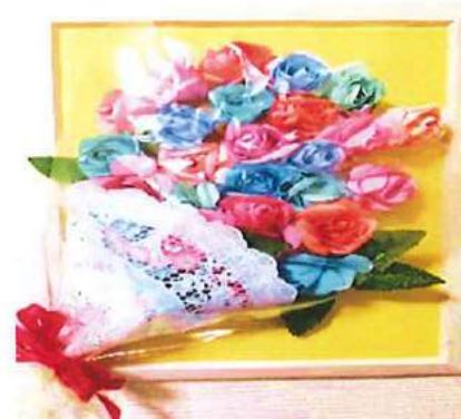
【老人ホーム入園者創作作品】