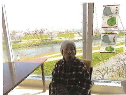
【リビングからのお花見】