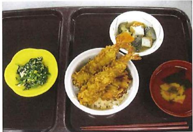
【リクエストメニュー 天丼】