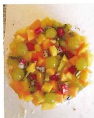
【フルーツケーキ作り】