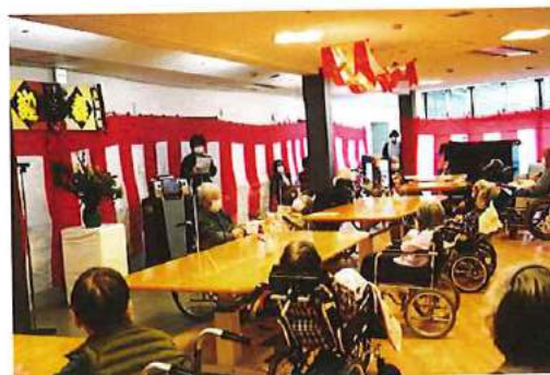
【新年祝い会の様子】