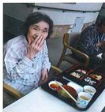
【店屋物の食事風景】