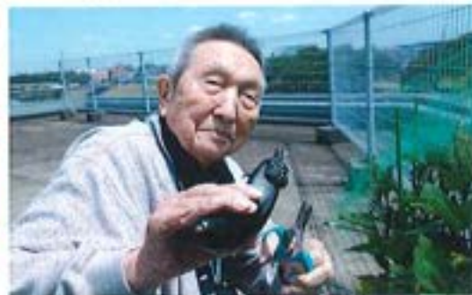
『屋上菜園 ～茄子の収穫～』