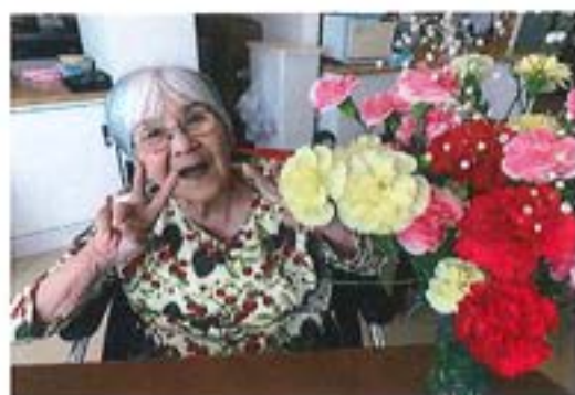
『母の日 ～いつもありがとう～』