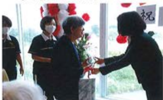
『敬老会 ～米寿のお祝い～』