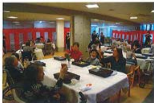
【敬老祝い会の食事風景】