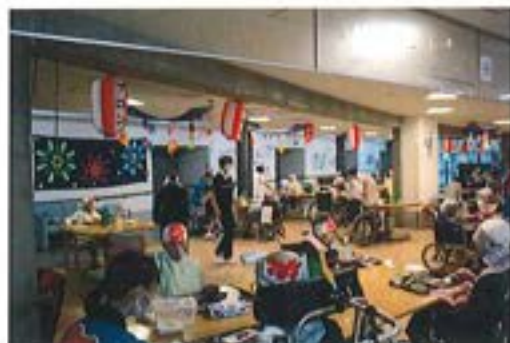
【夕涼み会の食事風景】