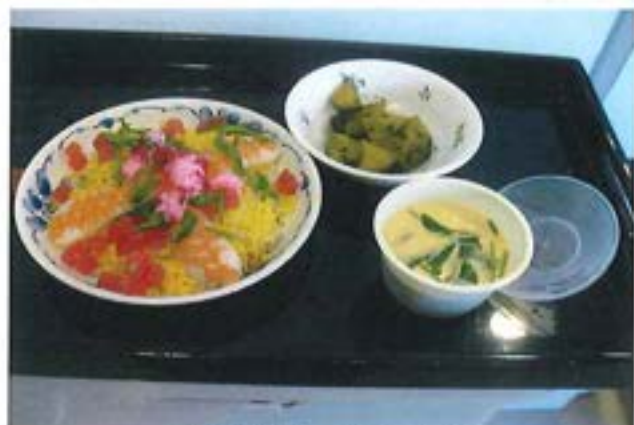
【実演調理 ちらし寿司】