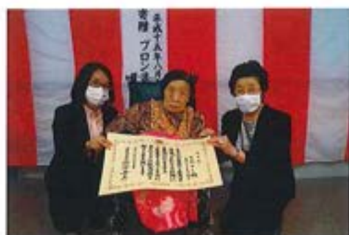
【表彰されたご利用者の記念撮影】