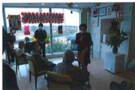
『新年祝い会 ～明けましておめでとう～』