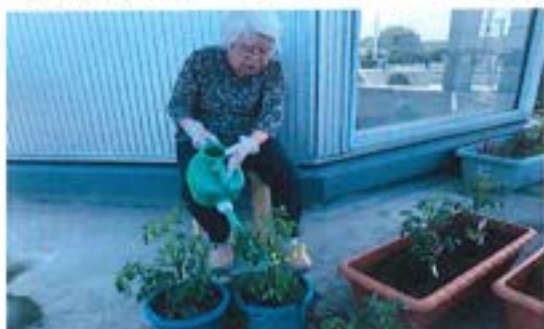
『屋上菜園 ～大きくなーれ～』