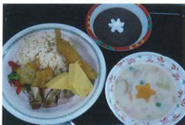
【デイ リクエストメニュー 夏のスタープレート】