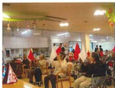
【誕生会での旗振りゲームの様子】