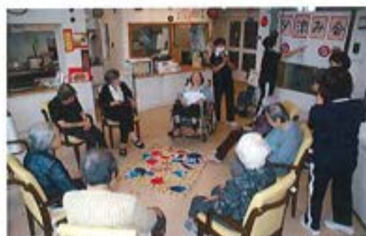
『夕涼み会 ～魚釣りゲーム～』