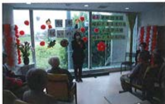
『敬老会 ～いつまでもお元気で～』