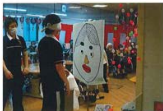
【新年祝い会での福笑いの様子】