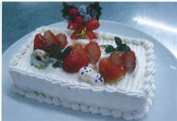
【クリスマスショートケーキ】