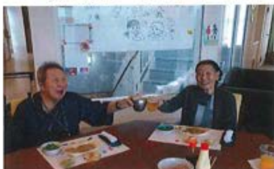
『夕涼み会 ～かんぱーい～』