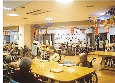
【夕涼み会の全体風景】