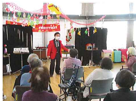
クリスマス会 マジックショーや音楽会を楽しんで いただきました