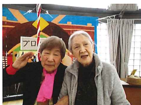
初詣 館内に建立された「ブロン神社」での 初詣となりました