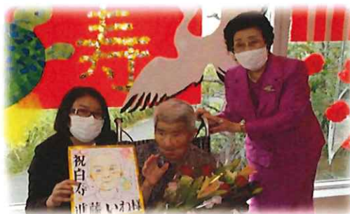
【敬老会 ～白寿のお祝い～】