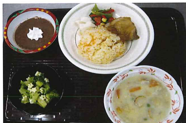
【クリスマスディナー】