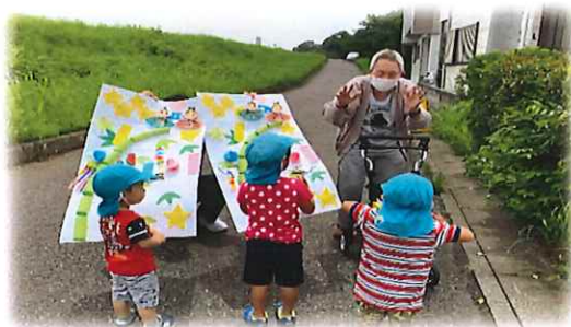
【園児と交流 ～毎月のプレゼント～】