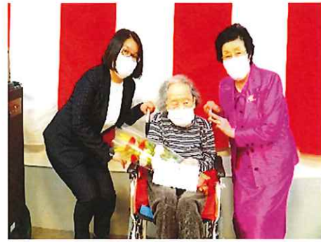
【表彰されたご利用者の記念撮影】