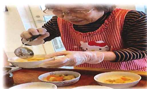
【食事盛り付け、頑張っています！】