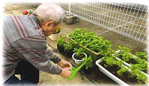
【藍を育てました！ ～次は藍染め～】