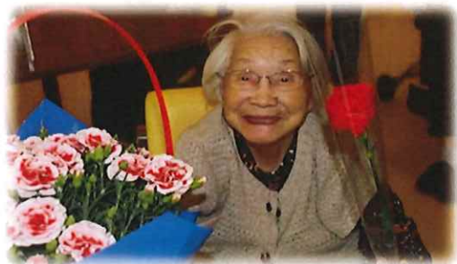
【母の日 ～いつもありがとう～】