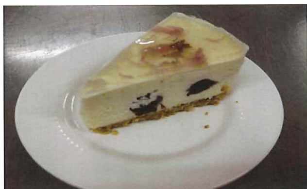
【桜のレアチーズケーキ】