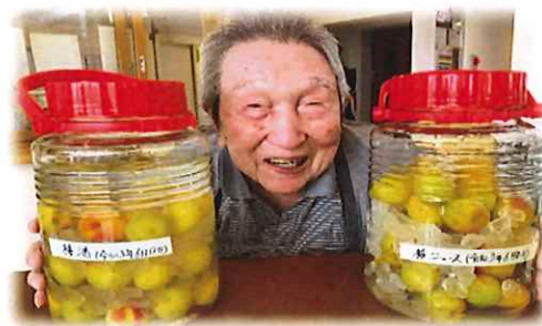
【梅酒・梅シロップをつくりました！】