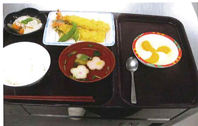
【リクエストメニュー 天ぷら盛り合わせ】