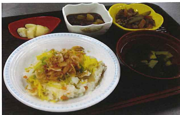
【端午の節句 桜エビのちらし寿司】