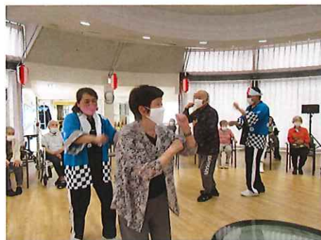
夏祭り 志木踊りや炭坑節、東京音頭を踊りました