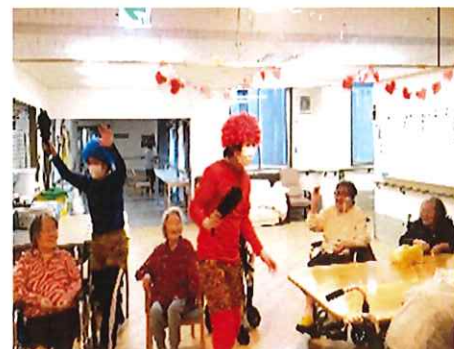
【節分・豆まきの様子】