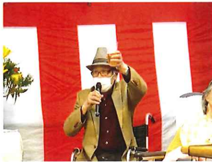
【新年祝い会での食事風景】