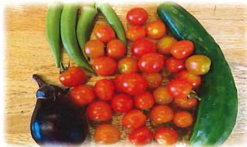
【屋上菜園 ～たくさん収穫～】