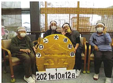
運動会 巨大な金メダルを作成して写真撮影 (銀メダルもあります)