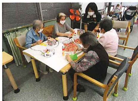
カレンダーづくり 皆さんにも協力していただきました