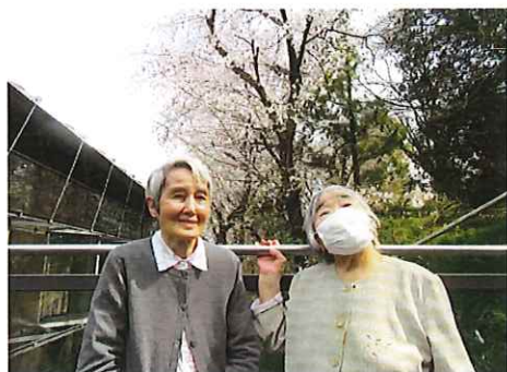
お花見 密をさけてのお花見です