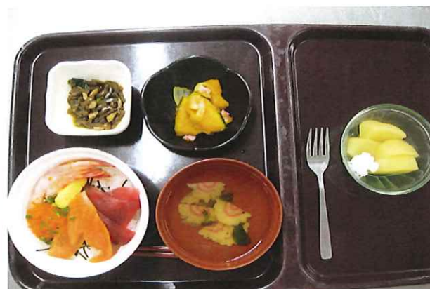
【リクエストメニュー 海鮮丼】