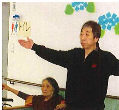
【レクリエーション体操の様子】