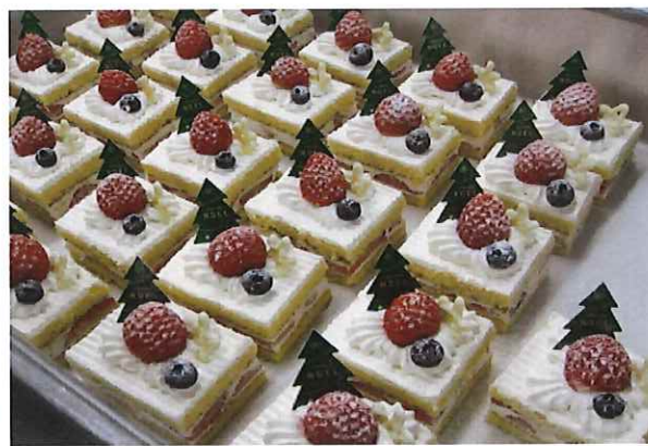
【クリスマスショートケーキ】