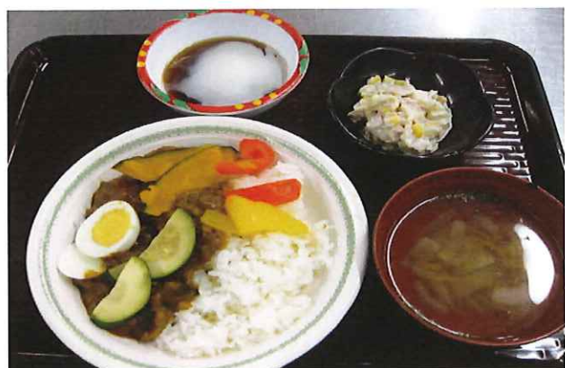
【実演調理 夏野菜キーマカレー】