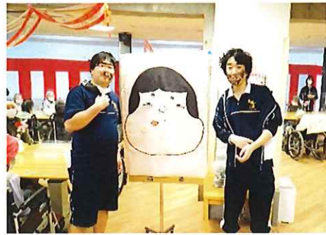
【新年祝い会での福笑いの様子】