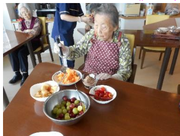
『季節のフルーツ盛りたくさん。お味はいかがですか?』