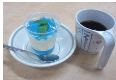
『 デザートは見た目も涼やかな “爽やかゼリー” でした 』