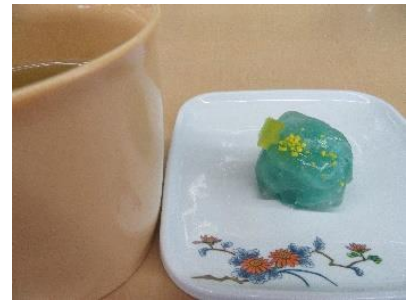
『七夕をイメージしたデザート😊』