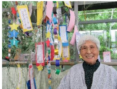
『 笹飾りと一緒に記念撮影📷 』