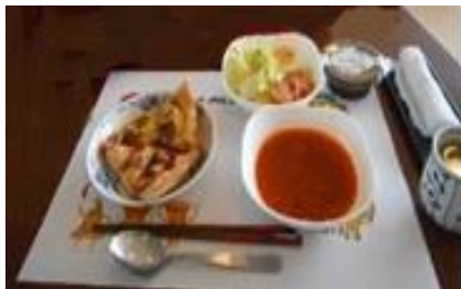
『久しぶりにピザをいただきました』