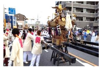
『敷島神社のお祭りが3年ぶりに開催されました』