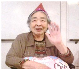
『 笑顔が素敵ですね♥ 』