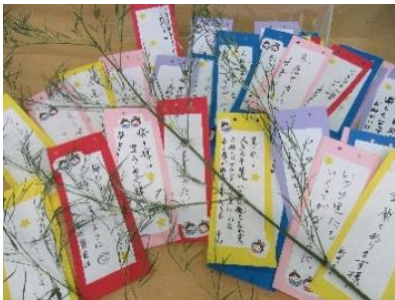
『 願いを込めた短冊です☆彡 』