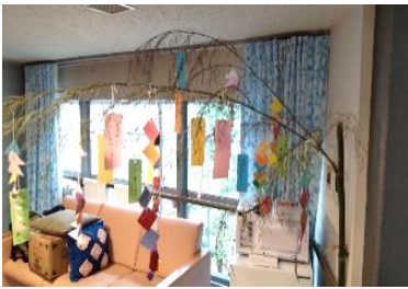
『短冊に願いを込めて♡』