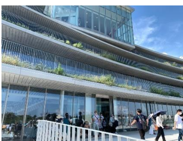
『 新庁舎の外観 』

7月19日(火)、志木市役所の新庁舎がオープンしました。31日(日)には『新庁舎等 完成記念イベント』が行われました。会場は志木市役所・新庁舎と、目の前に広がるいろは親水公園。当日は市役所の中を自由に見学できました。最上階の4階にあるテラスも開放されていて、ブロンの外観や新河岸川周辺の風景、近隣の街並みの全景を見渡すことができました。また、新河岸川の左岸(ブロンの対岸)にはやぐらが組み立てられ、志木踊りや炭坑節などの軽快なリズムに合わせて、たくさんの方々が3年ぶりの盆踊りを楽しんでいました。模擬店も多数出店されていて、大いに賑わった一日となりました。