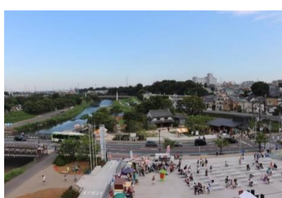
『 4階から見た景色です 』