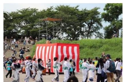
『 親水公園で行われた盆踊り♪ 』