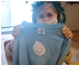
『 私へのプレゼントです!! 』