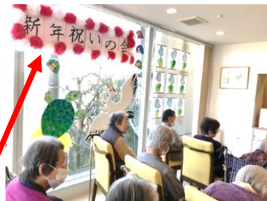
『ソーシャルディスタンスを忘れずに』