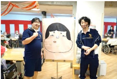
『福笑いの出来栄は?』