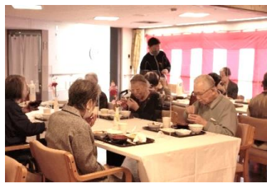
『会食のご様子です』