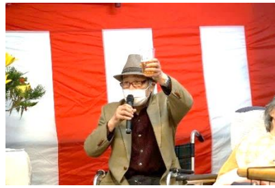
『入所者を代表して乾杯🍷』