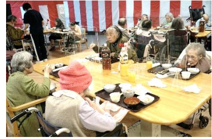
『しっかり食べて今年も元気!』