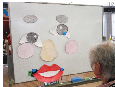
『福笑いで、アッハハ😊』