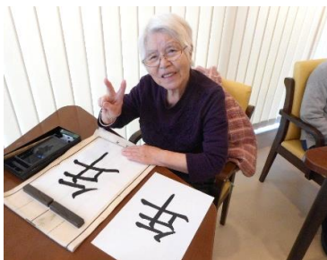
『このパネル、私が書きました』