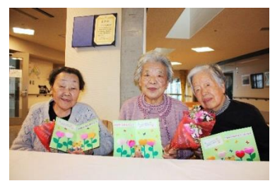
『誕生日、おめでとうございます♡』