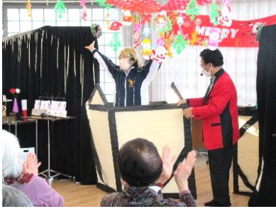
『見事な手品にビックリ！』