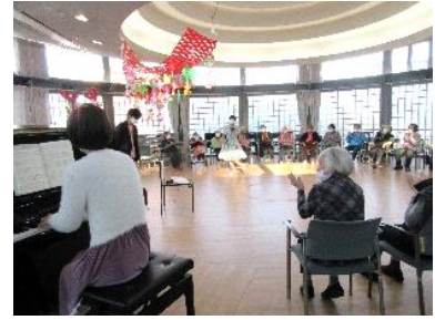
『♪音楽に合わせて手拍子♪』