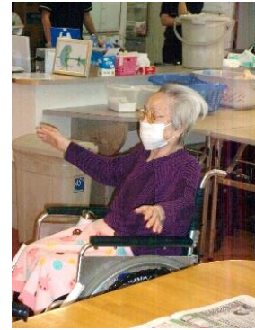
『私も頑張ってます！』