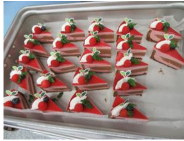
『手作りケーキ、おいしかったね♡』