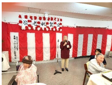
『皆様の長寿を祝って乾杯～！』