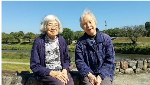
『青空を背景に、記念撮影です📷』