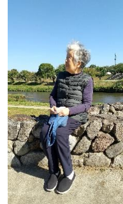
『風が気持ちいいね🎵』