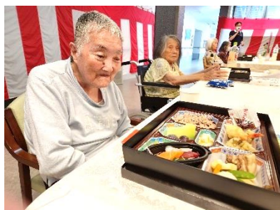
『とっても美味しそう♡』