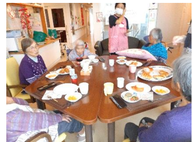
『皆さんと一緒に、いただきまーす🎵』