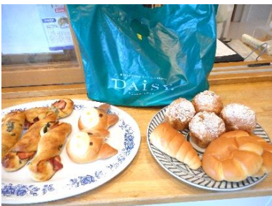
『まずはパン選び。どれも美味しそうで、迷ってしまいますね😊』