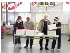
『白熱した当たりパン競争。パンはどちらの箱の中？』