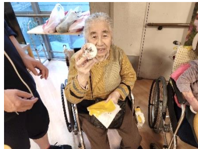
『プレゼント、ありがとう😊』