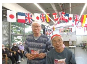
『美味しそうなパンを見事にゲットできました👏』