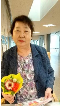
『誕生日おめでとうございます♡』