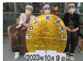
『今日は白組が勝利。金メダルと一緒に記念撮影です』