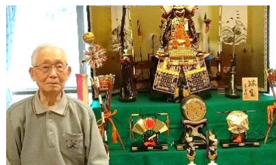
『黒一点のご入居者と一緒に📷』