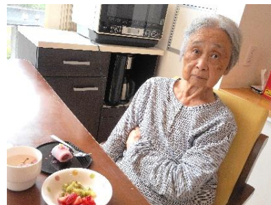
『きれいな風景を見ながら頂いています❤️』