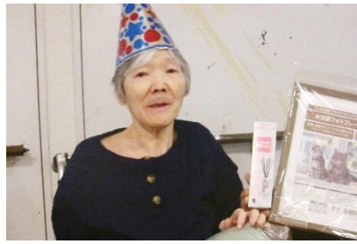
『写真立て、ありがとう❤️』