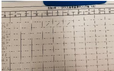
『体温も毎日記録しています』