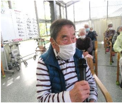
『私、初めてのカラオケです🎤』