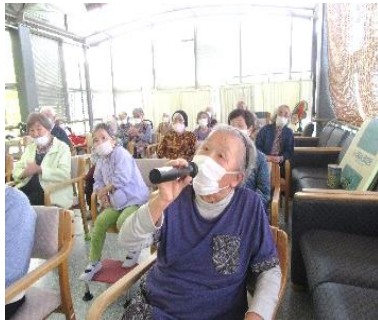
『私は久しぶりのカラオケ😊』