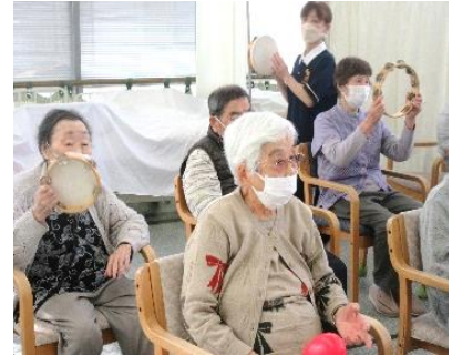
『新しいレクリエーションとして「リズムで元気」を始めました♪』