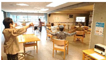
『毎朝、欠かさず行う体操♪』