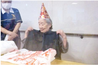
『どう？似合うかしら😊』