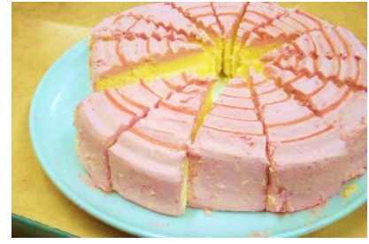
『好評だった苺のクリームケーキ🍓』